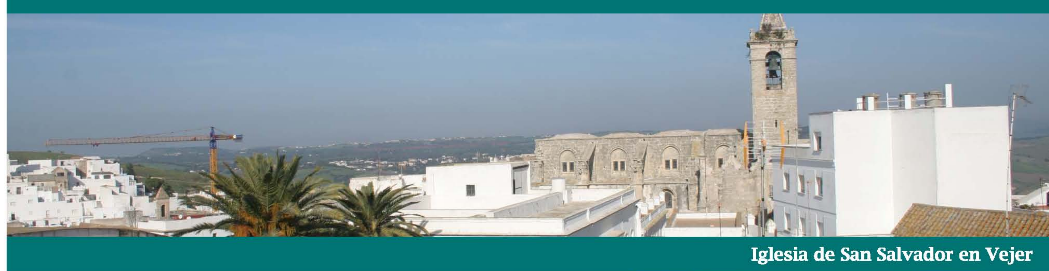
Iglesia de San Salvador en Vejer

Religión y arte siempre han ido de la mano. Ya sea por devoción, o por puro mecenazgo, en estas tierras, al igual que en muchas otras, distintas corrientes de arte y arquitectura pueden descubrirse en conventos, ermitas o iglesias.