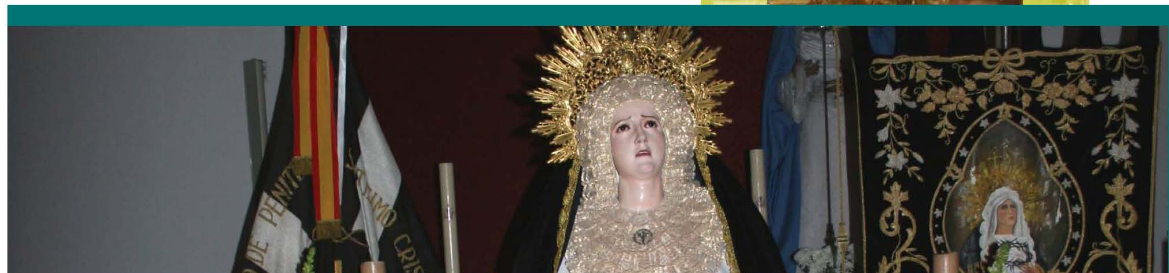
Nuestra Sra. del Carmen, en Barbate