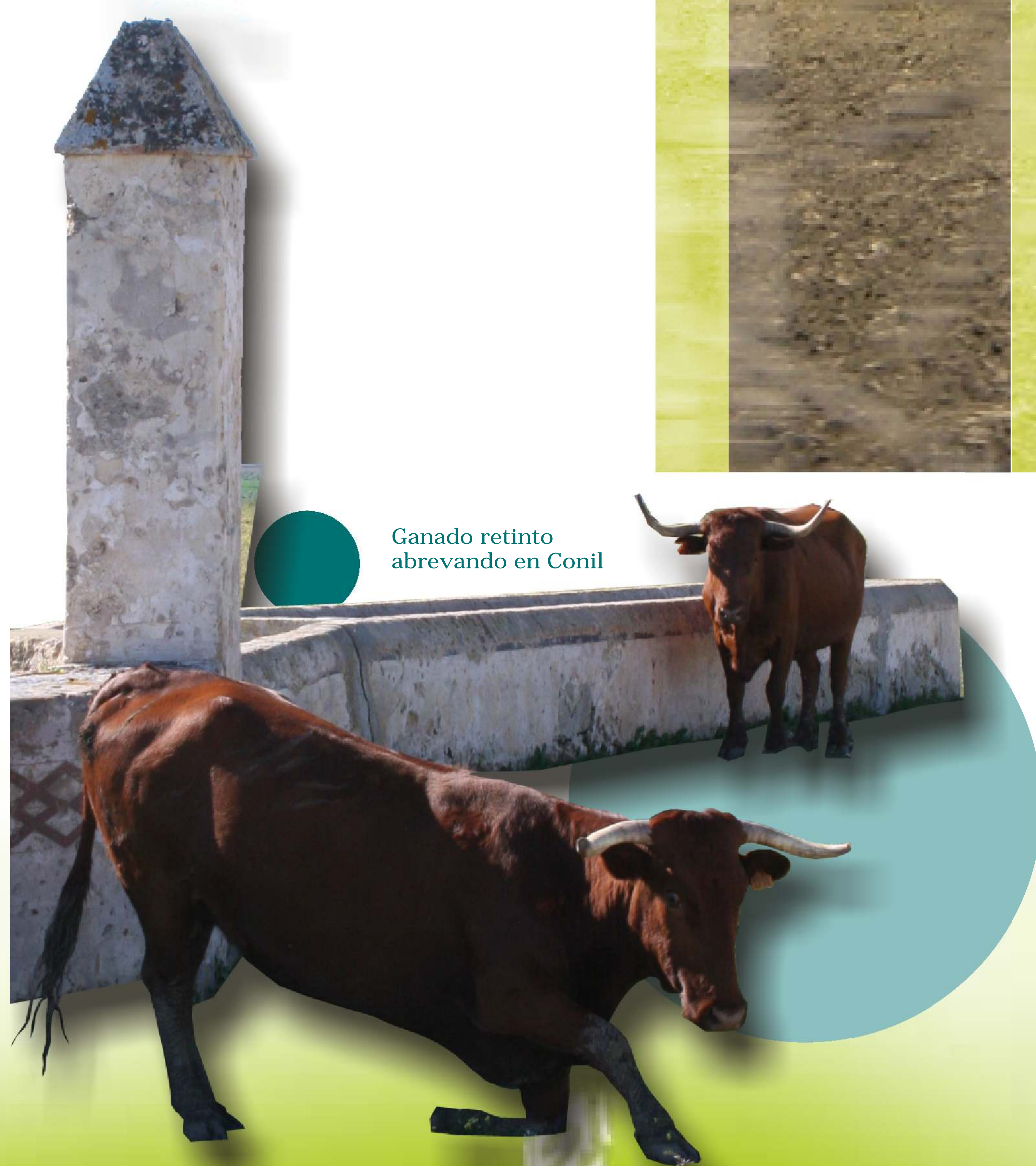
Ganado retinto abrevando en Conil