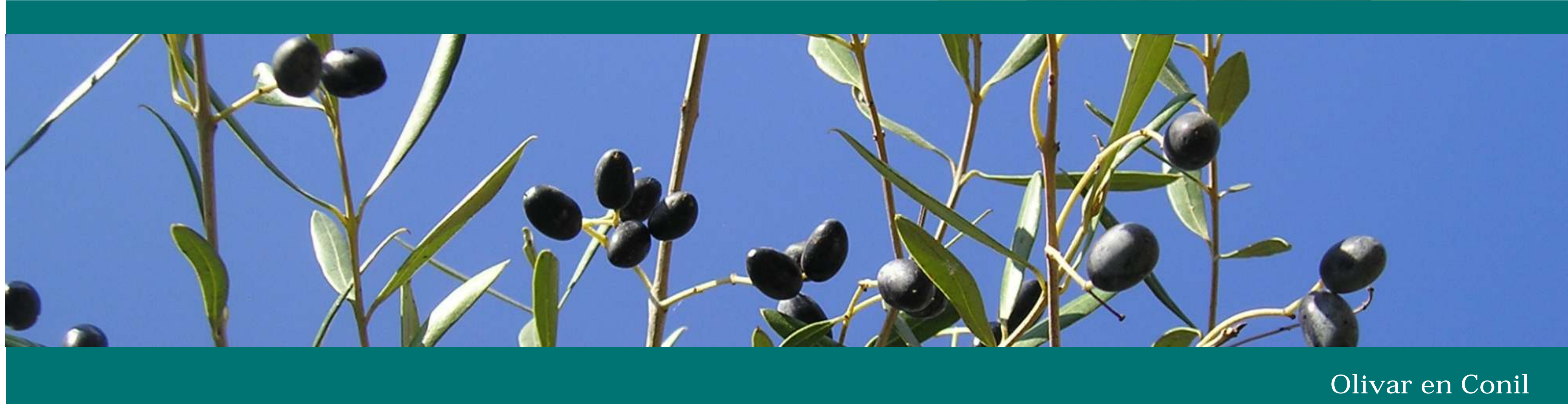
Olivar en Conil