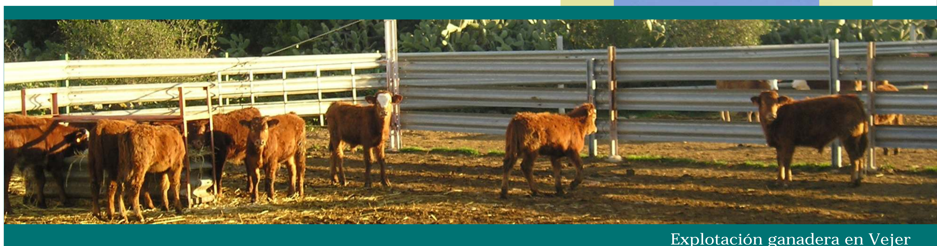
Explotación ganadera en Vejer

Para su construcción se utilizaban materiales propios de la zona como el acebuche o la pita, para el esqueleto, y la castañuela (que da nombre a estas construcciones), el junco o la enea para la cubierta. Un perfecto ejemplo de saber vivir con lo que nos da nuestro entorno más inmediato.