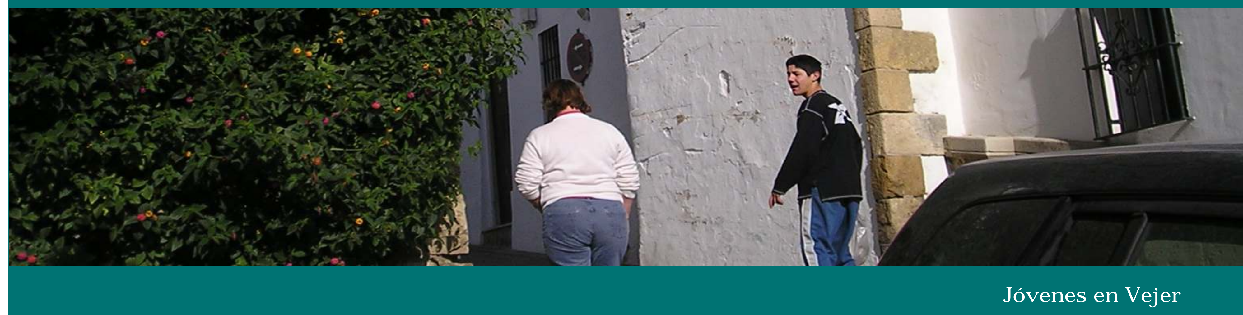
Jóvenes en Vejer

Al igual que se hacen esfuerzos para conservar otras muestras del patrimonio "palpable", estos también han de ir dirigidos a la difusión de palabras que nombran actividades u oficios para que no se pierdan en el olvido, ya que son precisas y ricas en matices.