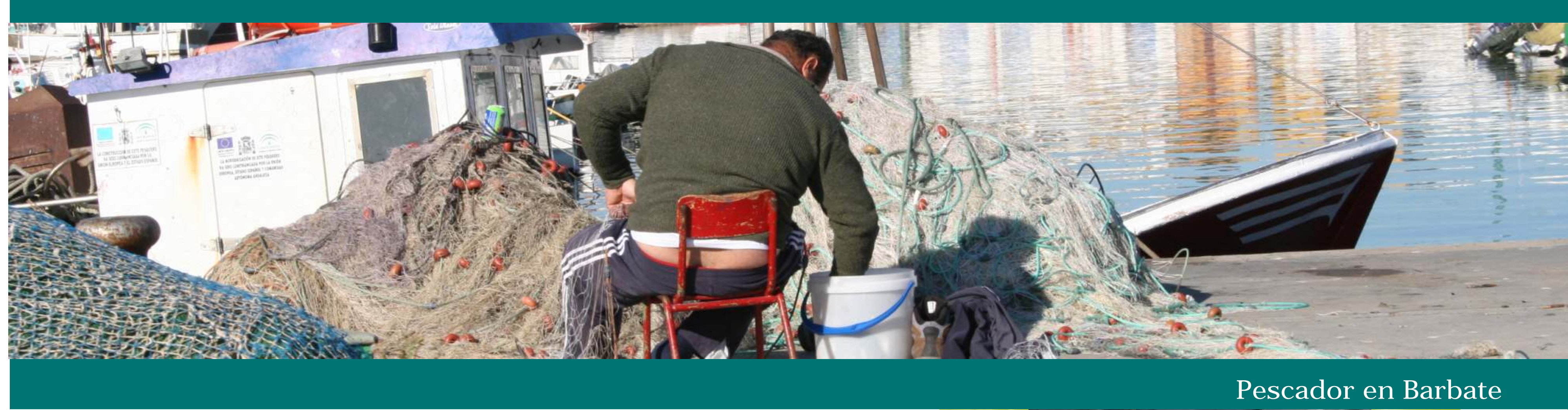
Pescador en Barbate

Ejemplos son la aljofifa, nombre que recibe el trapo usado para fregar el suelo, también llamado "josifa" y "josifar" en Vejer, y muchas palabras de origen árabe como acemite (la parte gruesa de la harina que queda después de cernirla) o almizcate (calle estrecha). Aparte de éstas, hay muchas relacionadas con la mar, las almadrabas, la pesca o la carpintería: ajiá, copejeá, latería, ñañarines, alvitana o brasola.