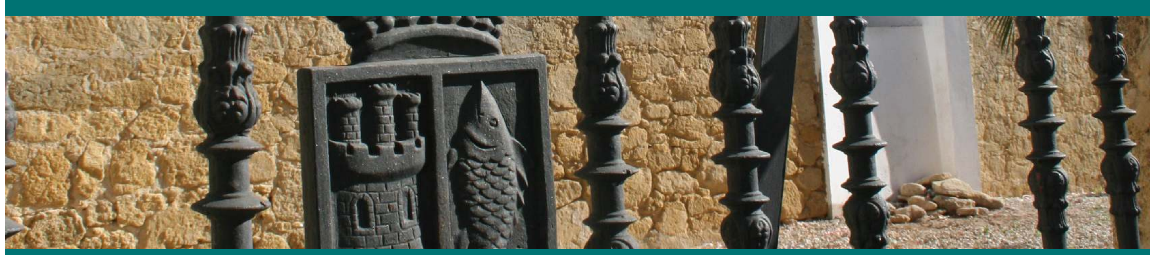
Detalle en verja de Conil