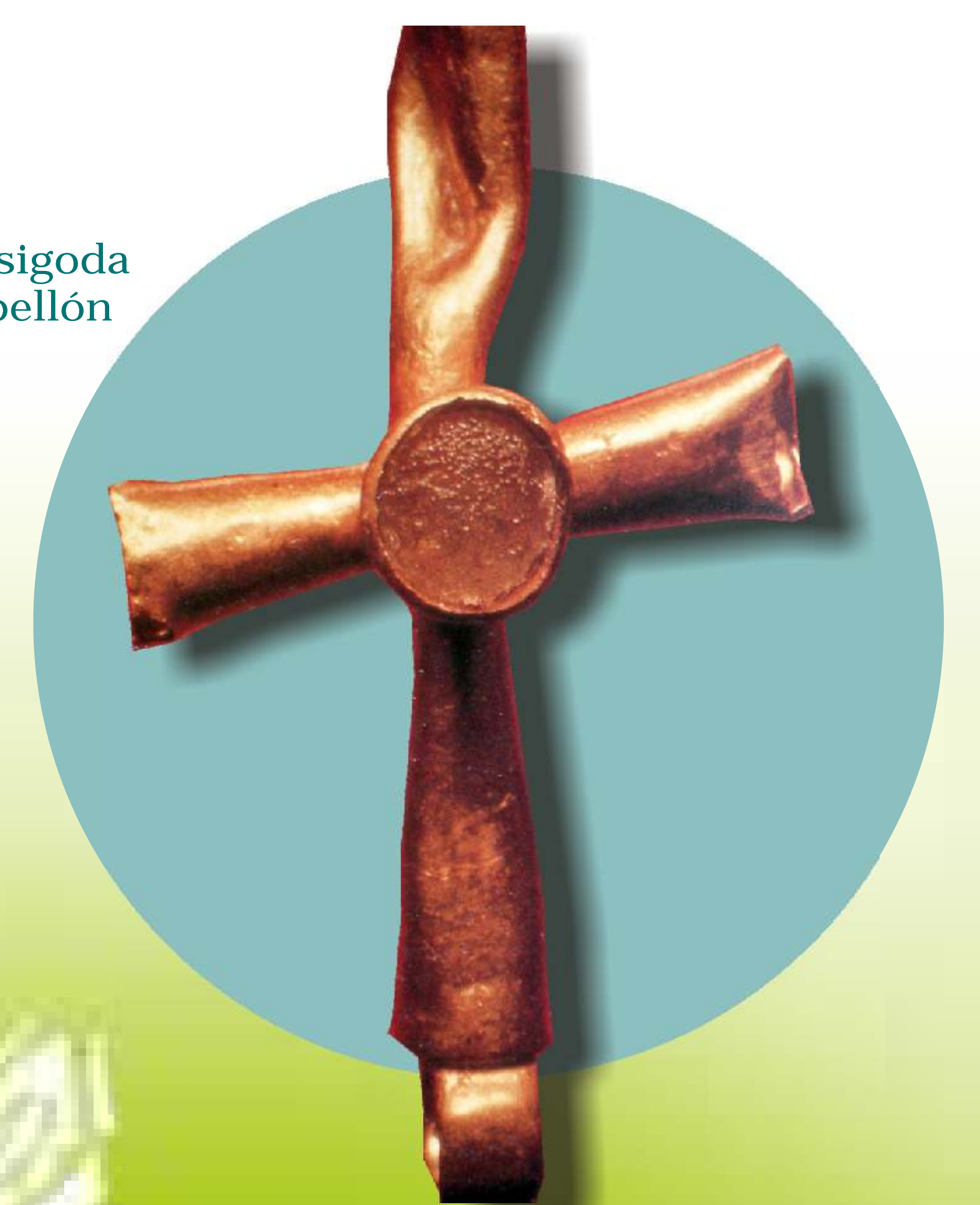
Cruz visigoda del Pabellón