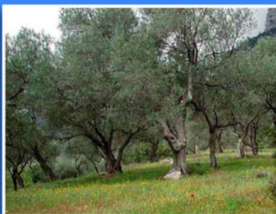
> ACEITE DE ACEBUCHINA