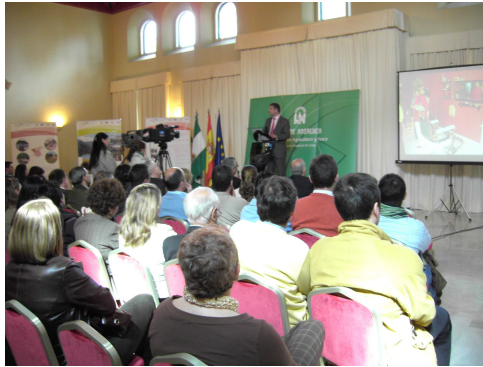
El Delegado Provincial inauguró la presentación comarcal de NERA

El Grupo de Desarrollo Rural (GDR) gaditano presenta una aplicación informática que hará más fácil recoger las opiniones de la población rural