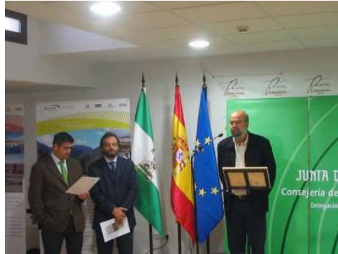
De izquierda a derecha, el Delegado Provincial, el Presidente del GDR y el Alcalde de Conil

La población rural decidirá las líneas maestras del futuro plan de desarrollo comarcal