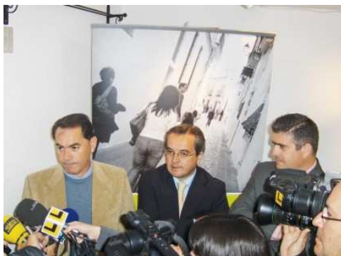
En la presentación se dieron cita representantes del tejido económico y social del territorio

Durante el marco anterior se apostó por la valorización de los recursos naturales y culturales