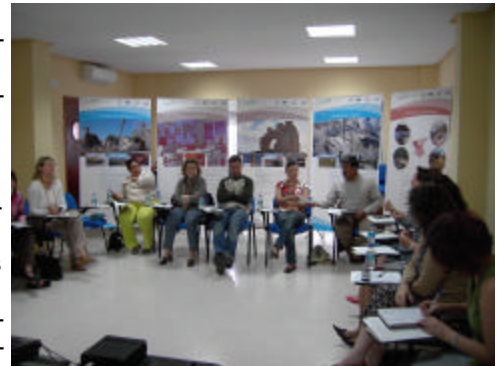
Imagen de uno de los actos participativos

Entre las personas asistentes a estos espacios de participación, más de 110, se ha contado con una buena representación de la sociedad rural a la que precisamente se quiere implicar en este proyecto, y entre las que están alcaldes, delegados y delegadas de alcaldía, representantes del movimiento asociativo y vecinal, organizaciones agrarias, empresariales y sindicales, asociaciones de mujeres, jóvenes y agricultores, además de una nutrida representación de emprendedores. Igualmente, se invitó a representantes de instituciones y administraciones públicas, así como a profesionales y técnicos expertos en cada una de las materias a tratar.