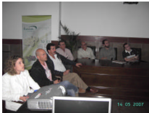
Imagen de una de las mesas organizadas por el GDR de la Sierra de Cádiz

Estas mesas sectoriales reúnen a instituciones, Administraciones Públicas y representantes la sociedad rural a la que precisamente se quiere implicar en este proyecto, y entre las que están alcaldes, concejales, representantes del movimiento asociativo y vecinal, organizaciones agrarias, empresariales y sindicales, colectivos de mujeres, jóvenes y agricultores y una nutrida representación del empresariado de la comarca.