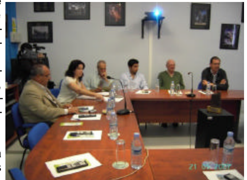
En la foto, una de las mesas temáticas celebradas por el GDR de los Alcornocales

Entre las personas invitadas a participar en estas mesas temáticas sectoriales se cuenta con una buena representación de la sociedad rural a la que precisamente se quiere implicar en este proyecto, y entre las que están alcaldes, representantes del movi-