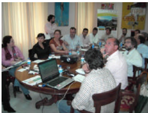
Gran número de participantes en las sesiones de debate organizadas por el GDR de la Campiña de Jerez

En cualquier caso, se subrayó el buen nivel participativo y de movilización que presenta la población de la comarca, especialmente, la población femenina, aunque es necesario motivar a los jóvenes para su incorporación a estos procesos desde la infancia.