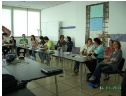
En las mesas temáticas han participado agentes clave de los diferentes sectores abordados

Las distintas cuestiones planteadas en cada mesa se han elaborado considerando las opiniones de los diversos agentes sociales, económicos y políticos entrevistados del territorio, los resultados, en ciertos casos, dan algunos estudios o planes recientemente elaborados, las indicaciones técnicas de los asesores del proyecto NERA y la puesta en común que, permanentemente, se viene realizando con los otros Grupos de Desarrollo Rural de la provincia de Cádiz.