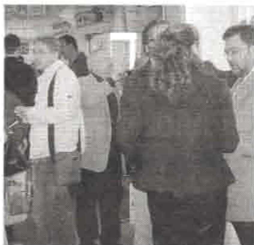
Degustación de productos de la provincia en el stand.