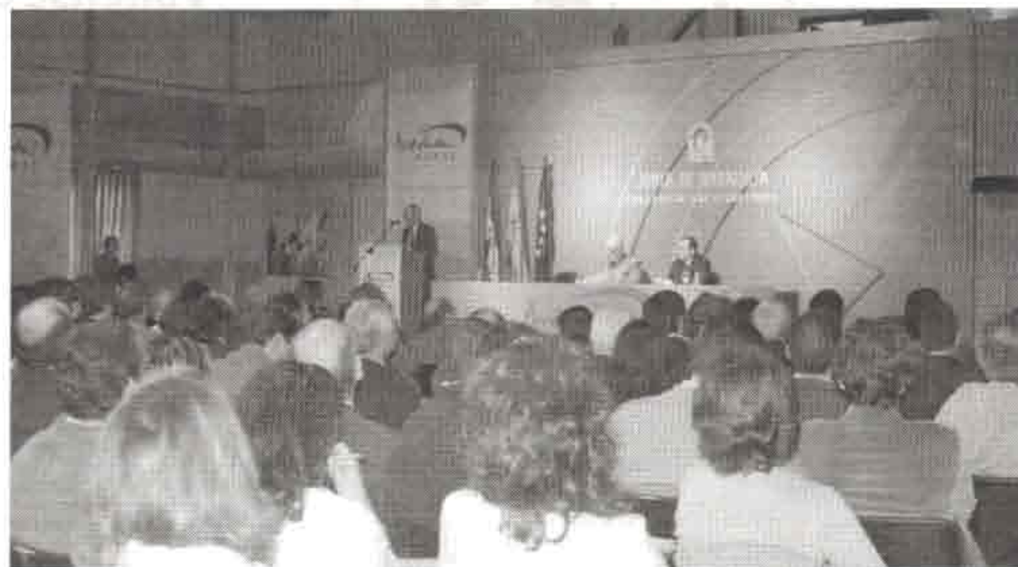
La presentación tuvo lugar el pasado 26 de febrero en la Consejería de Agricultura y Pesca ante numeroso público.

DESARROLLO RURAL Los 50 GDR andaluces han apoyado multitud de proyectos, reflejo del compromiso de la población