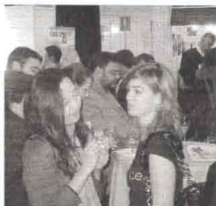
Gran éxito de los productos alcornocaleses en la muestra.