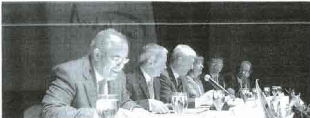
COORDINACIÓN. La presentación se realizó ante un público formado por buena parte de los actores de la zona rural.