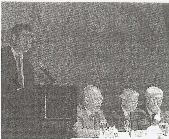
El delegado provincial de Agricultura, ayer en Jerez, durante la presentación.