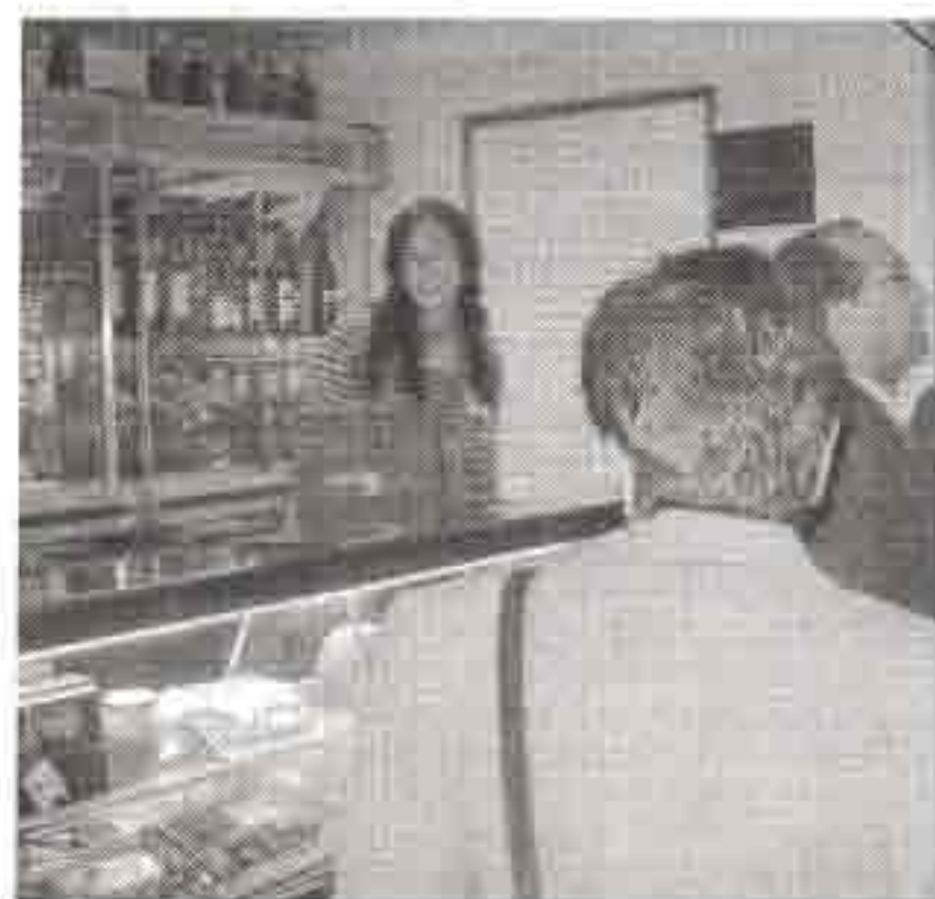
Unidad Expositora Móvil de la Asociación.