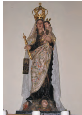
Imagen de talla completa y de madera policromada que representa a Nuestra Señora del Carmen, titular del templo, con el niño Jesús en su brazo izquierdo. Detalles como los cálidos brotes de color del manto, el ligero contraposto de su postura, la leve inclinación de la cabeza del niño y la tímida sonrisa de la Virgen confieren a esta imagen naturalidad y expresividad.