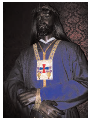
Imagen de vestir (talladas piernas, brazos y cabeza) de madera de caoba policromada y cabellera de pelo natural, que representa, al parecer, a Jesucristo en el instante de su prendimiento (Jn 18, 12). Decimos al parecer puesto que la corona de espinas que presenta le sería colocada en un momento posterior de la Pasión (Jn 19, 2).

En realidad, tal iconografía reproduce la del madrileño Cristo de Medinaceli, una talla de similar factura a la que nos ocupa que fue rescatada en 1682 por unos frailes trinitarios en Mequínez (Marruecos), y que llegaría a gozar de una gran veneración en nuestro país. El origen de su denominación hay que buscarlo en la especial protección que los duques de Medinaceli le dispensaron.