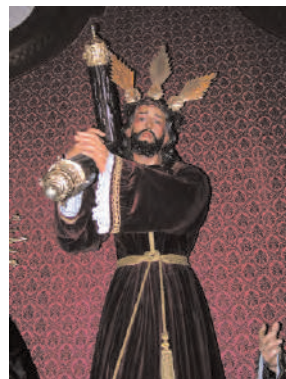
Imagen de talla completa, de brazos articulados y de madera policromada de aproximadamente un metro y sesenta centímetros de altura que representa a Jesucristo en uno de los instantes de la Pasión más rememorados, cuando con la cruz a cuestas, a duras penas, caminaba hacia el monte Calvario para su crucifixión (Jn 19, 17).