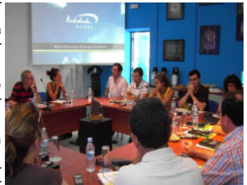
En la foto, una de las reuniones del GDR de Los Alcornocales para la elaboración de la matriz DAFO