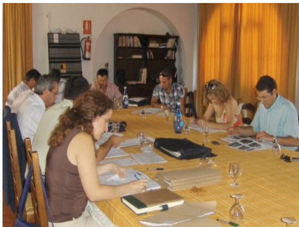
En la imagen, un momento de la segunda mesa comarcal organizada en la comarca de la Sierra de Cádiz

Técnicos de desarrollo rural y expertos ya han validado las DAFO de las diversas mesas sectoriales celebradas en los últimos meses, amenazas, debilidades, fortalezas y oportunidades que aportan las claves para trazar las líneas estratégicas comarcales