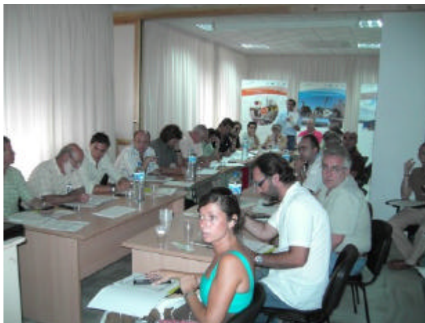
El GDR del Litoral de la Janda ya tiene perfilados los elementos clave de su futura estrategia de desarrollo

El pasado jueves 26 de julio tuvo lugar la segunda reunión de la mesa comarcal del Litoral de la Janda, enmarcada en el Proyecto NERA. Una treintena de actores locales, representantes de los diferentes colectivos económicos y sociales de la comarca, estuvieron presentes en esta sesión de trabajo, en la que se finalizó el diagnóstico del territorio y se inició la definición de los objetivos, generales y temáticos, de la estrategia de desarrollo del Litoral de la Janda para el periodo 2007-2013