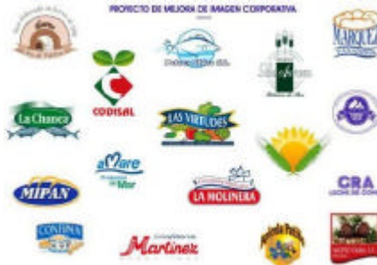
imagen corporativa y de packaging. Así, cada una de las empresas asociadas tuvo la oportunidad de contar con un experto diseñador en temas alimentarios, que atendió personalmente cada una de las necesidades de la empresa. Finalmente, fueron 36 los diseños y adaptaciones realizadas por la asistencia técnica. Este proyecto, debido a la atención personalizada a cada uno de los empresarios, se extendió a lo largo de los años 2004 y 2005.

La innovación en la gestión, la apertura de nuevos mercados y la proyección al exterior de una imagen común de la oferta alimentaria del Litoral de la Janda, exigía nuevas actuaciones colectivas que dieran respuesta a estas necesidades. La determinación fue clara, y pronto se puso en marcha el siguiente proyecto por parte de la asociación. En 2005 se iniciaron los trabajos para el diseño y desarrollo de una página web de la Asociación de Productores Alimentarios de Calidad del Litoral de la Janda www.jandalitoral.com . Esta web contiene