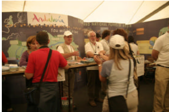
Tarifa acoge la segunda reunión del grupo de trabajo formado para implantar la Carta Europea de Turismo Sostenible

Tarifa acoge la segunda reunión del grupo de trabajo para la implantación de la CETS en el Parque Natural del Estrecho, formado por una representación de empresarios del Campo de Gibraltar, el Grupo de Desarrollo Rural de Los Alcornocales, el Parque Natural del Estrecho y la Fundación Andanatura.