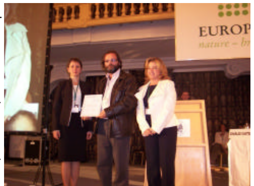
En la imagen, el presidente del GDR del Litoral de la Janda recibiendo el certificado de la CETS

Castro Romero precisó que la concertación, la cooperación y el compromiso de todos los actores locales, y más especialmente los integrados en el sector turístico,