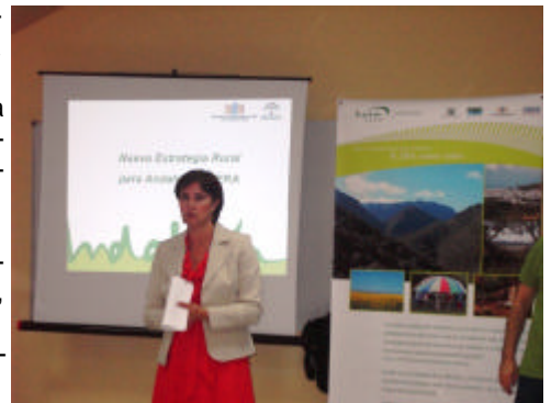
En la foto, la presidenta del GDR de la Campiña de Jerez durante la tercera sesión de la mesa comarcal

tivos a este proceso están disponibles para su consulta pública en la web del GDR www.jerezrural.com , ya que "nuestro objetivo es hacer de NERA un proyecto participativo y transparente".