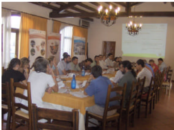
El GDR de la Sierra de Cádiz celebró su tercera mesa comarcal el pasado 25 de septiembre en El Bosque

El enfoque de género y la sostenibilidad ambiental, piedras angulares de las actuaciones que se llevarán a cabo en la Sierra de Cádiz durante el periodo 2007-2013