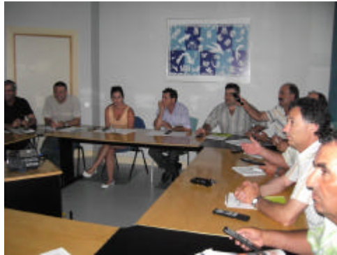
En la foto, participantes en una mesa de trabajo utilizando el software Impact Explorer

El Grupo de Desarrollo Rural de la Campiña de Jerez, GDR coordinador en la provincia gaditana, se reúne con miembros de la Dirección General de Desarrollo Rural de la Consejería de Agricultura y Pesca para ultimar los pasos previos a la elaboración de su estrategia provincial, siendo Cádiz la primera provincia andaluza en iniciar este proceso