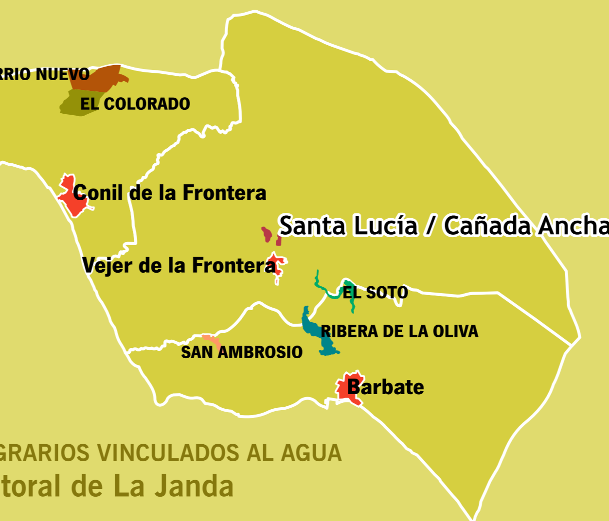
PAISAJES AGRARIOS VINCULADOS AL AGUA Litoral de La Janda

Las hileras de árboles y matorrales hacen las veces de límite entre las diferentes parcelas. Es una práctica común aprovecharlos y así evitar la