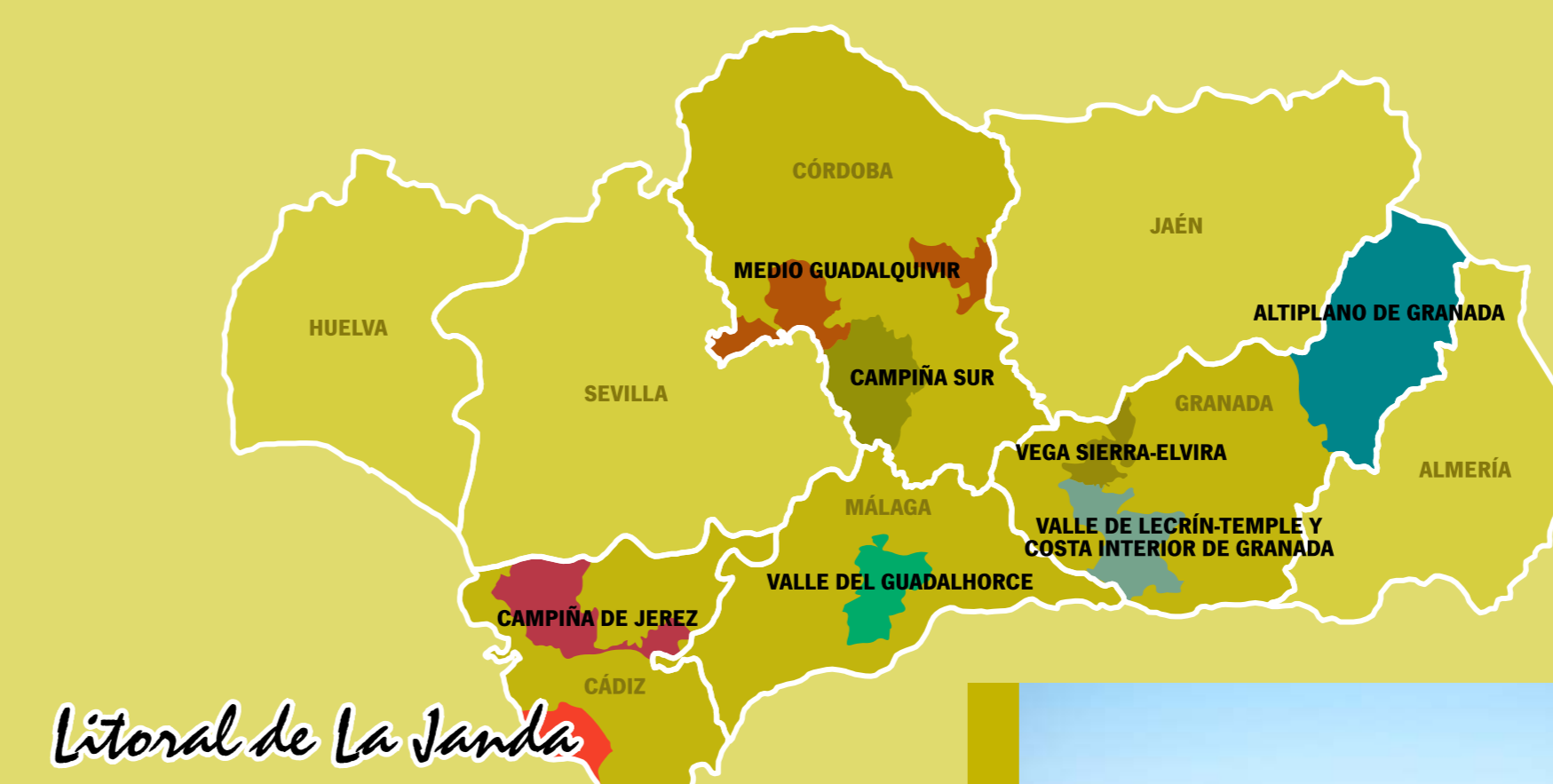
Litoral de La Janda