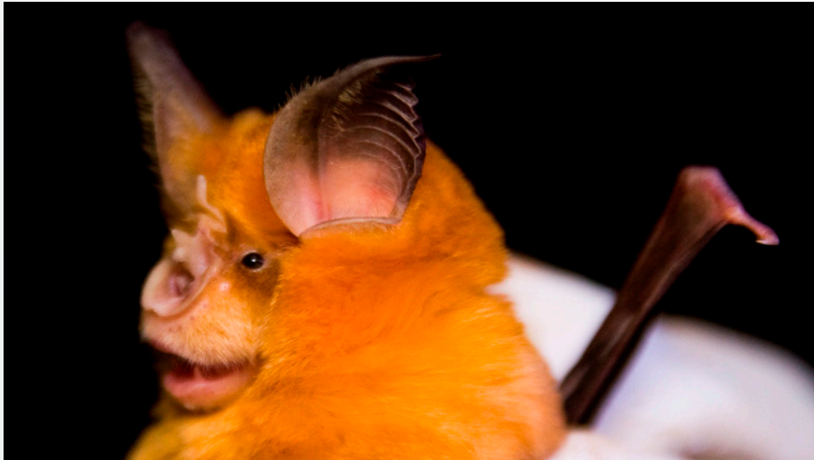
Murciélago mediano de herradura ( Rhinolophus mehelyi ).