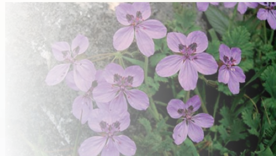
Erodium primulaeum . Autoras: Úrsula Osuna y Begoña Garrido