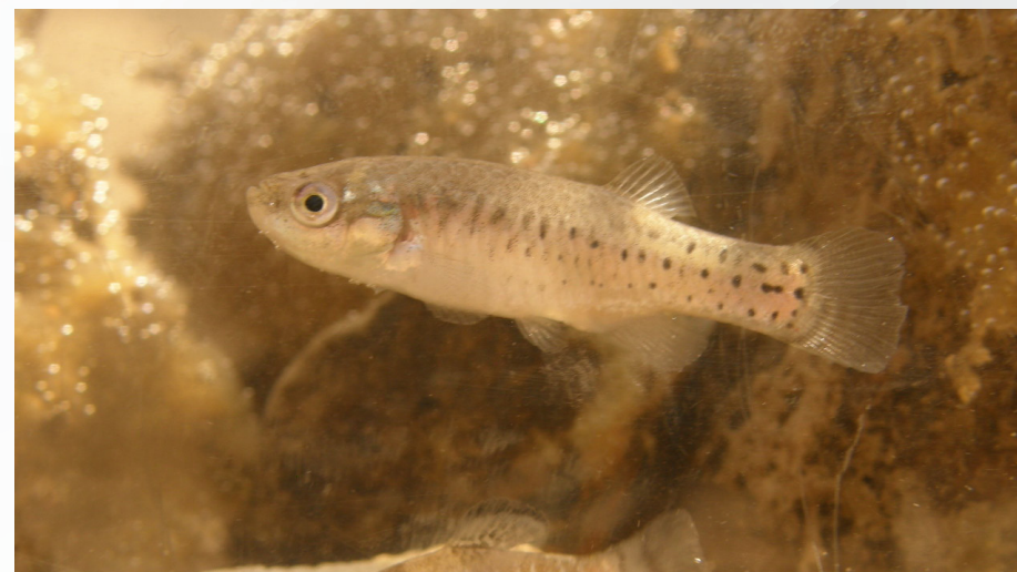
Salinete ( Aphanius baeticus )