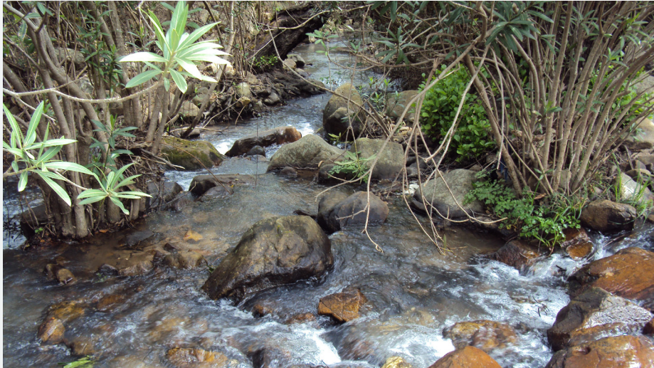
Río de la Jara aguas arriba.