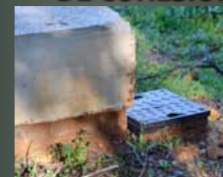
Conducciones de Majarambuz "Más calidad hídrica para Castellar de la Frontera"