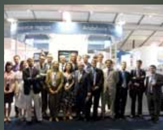
Extenda "Puertas abiertas al Mercado Global"