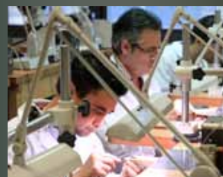
Consortio Escuela de Joyería "Excelencia formativa desde Córdoba"