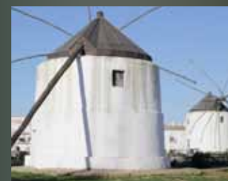
GDR Litoral de la Janda "Hacia un turismo más sostenible"