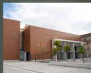
Teatro de Huéscar "Una restauración muy respetuosa"