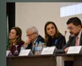
Especialización Inteligente y Acto Anual de Comunicación