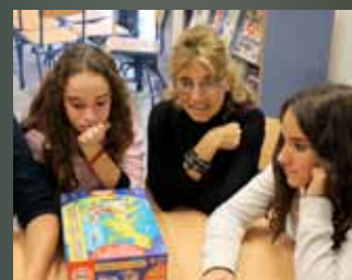
- III Concurso "Andalucía se mueve con Europa" - INFORM 2012 - Oficina Técnica